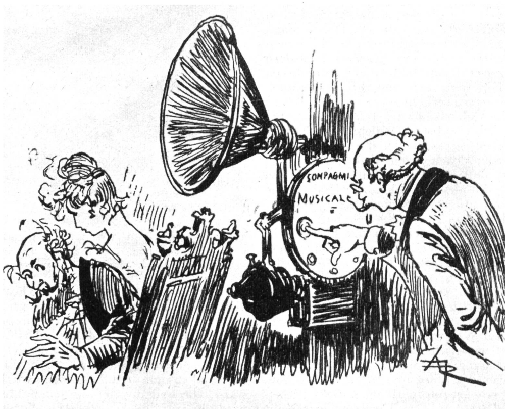
Abb. 4. Fernempfang über Drahtleitung mit Programmwahl durch Druckknopfbedienung. Der Zeichner hat diese modernste technische Errungenschaft bereits im Jahre 1883 vorausgeahnt. „Das zwanzigste Jahrhundert“ von Robida, Paris.

phonischen Rundspruchanlagen errichtet. Ein Mitarbeiter Edisons, der ungarische Ingenieur Puska , schuf im Jahre 1893 den ersten europäischen Draht-rundspruch in Budapest, der in verbesserter Form auch heute noch besteht. In Paris, London und andern Städten wurden ähnliche Einrichtungen getroffen und wer weiss, wie rasch sich dieses System in der ganzen Welt eingebürgert hätte, wenn nicht das