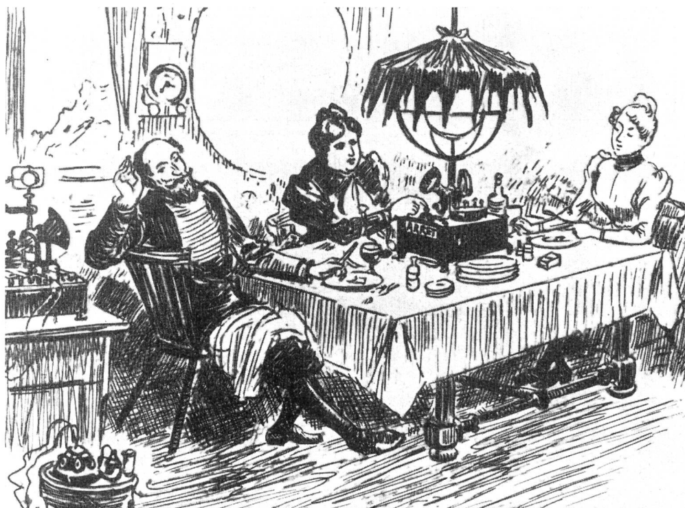
Abb. 5. Fernkonzert im Familienkreise im Jahre 1883. „Das zwanzigste Jahrhundert“ von Robida, Paris.

Radio gekommen wäre und den Drahttrundspruch vorerst verdrängt hätte. Es dauerte aber nur wenige Jahre und der Drahttrundspruch tauchte in veränderter Gestalt wieder auf. Er hatte sich alle die grossen Erfindungen zunutze gemacht, die im Ge-