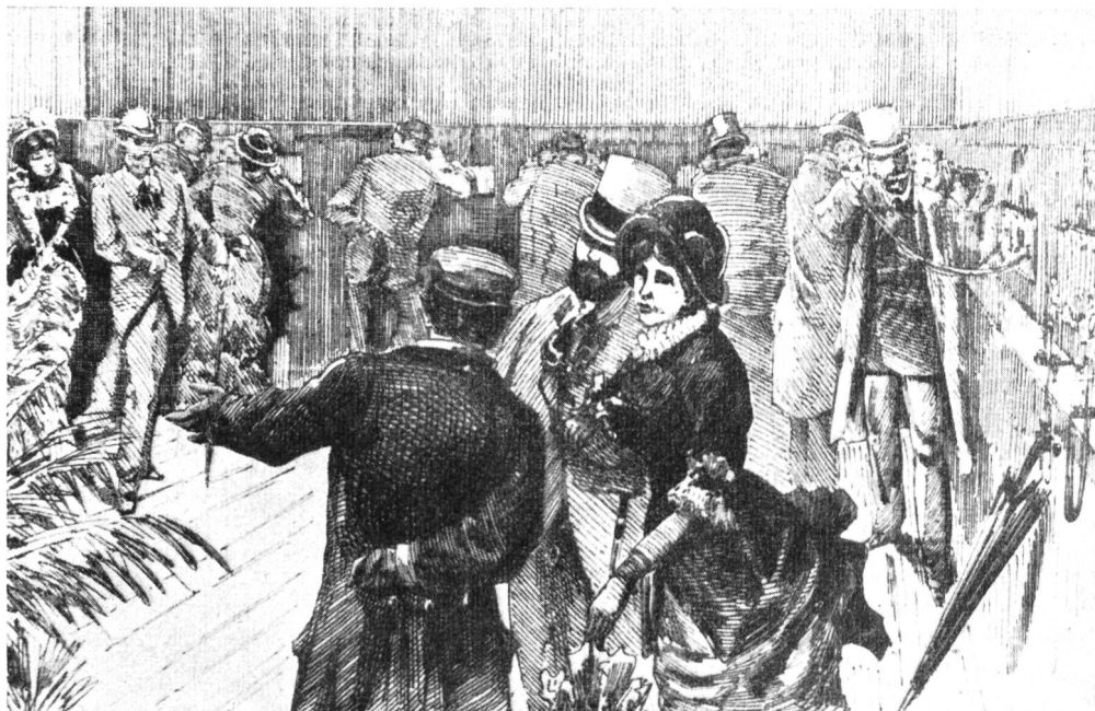
Abb. 3. Fernkonzerte in der Internationalen Elektrizitätsausstellung in Wien 1883. Zeitgenössisches Zeitungsblatt.

Die wirkliche Technik war allerdings noch nicht so weit. Einen Markstein auf ihrem Weg bildet die telephonische Musikübertragung eines Konzertes aus der Metropolitan-Opera in New York, die Edison im Jahre 1891 unternahm. Nahezu tausend Zuhörer waren in einem Saal versammelt, an dessen Wänden sechs Edisonsche Lautsprecher-Telephone befestigt waren. Zwei Jahre später wurden die ersten tele-