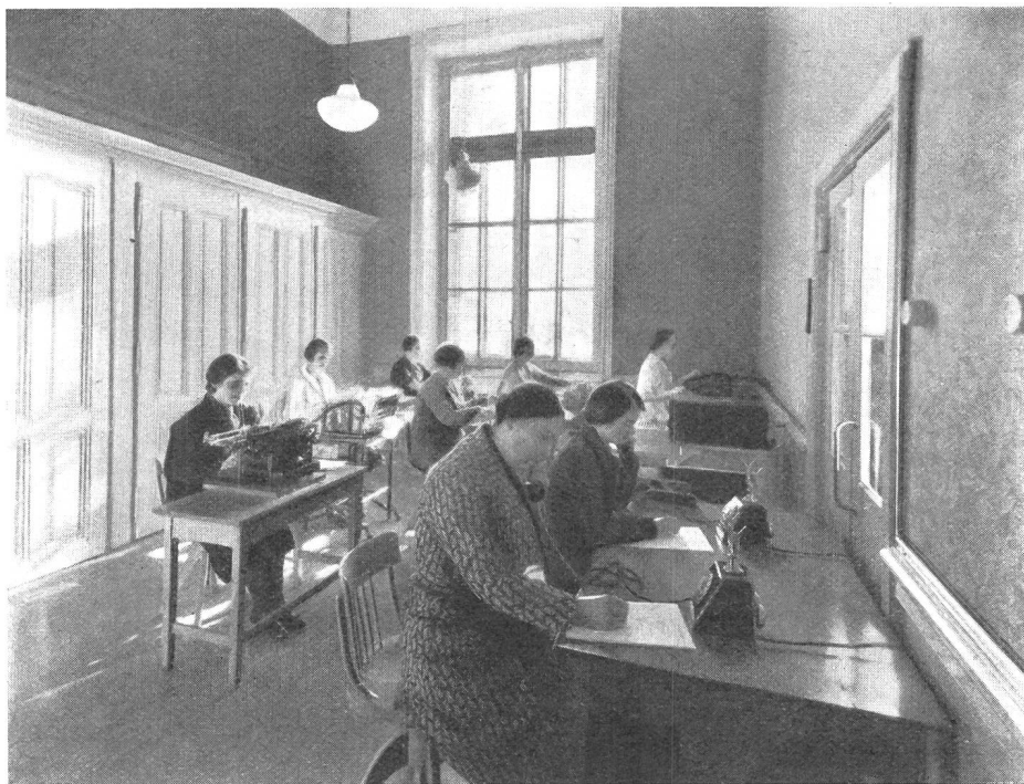
Fig. 2. Salle des machines et appareil de projection des films photographiques des compteurs.

agentes au service de la comptabilité, durant les premiers jours du mois. Cette manière de faire avait l'inconvénient de compliquer l'établissement de l'horaire de la centrale, où l'emploi du personnel ne pouvait plus être réparti sur l'ensemble du mois; une diminution importante des présences à une époque déterminée rendrait l'exploitation impossible.