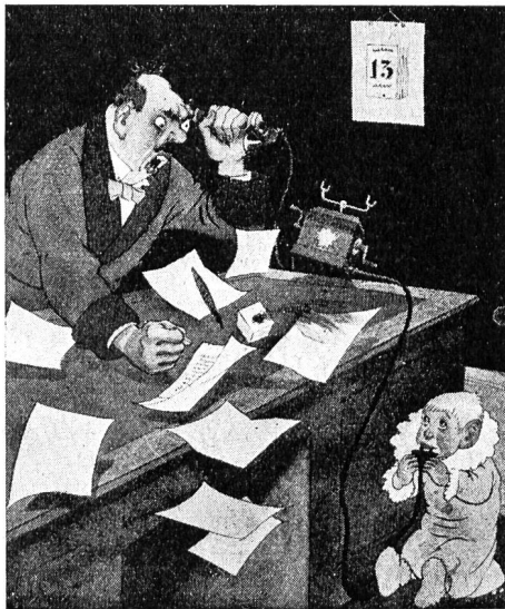
Fig. 2. (Kasper.)

Jeder gewissenhafte Fabrikant prüft die von ihm erzeugten Artikel mit allen ihm zu Gebote stehenden Mitteln. Er will überzeugt sein, dass die Ware, die er später seinen Kunden zu verkaufen gedenkt, diese