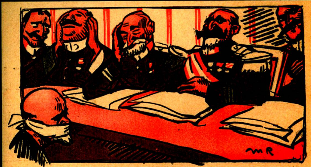
LA JUSTICE ESPAGNOLE Après le bandeau sur la bouche.....