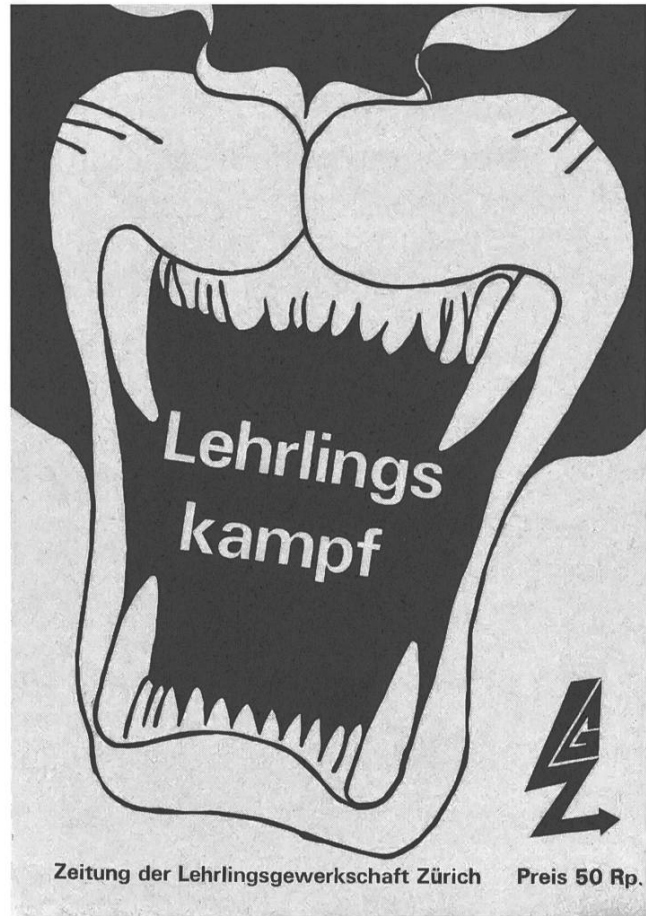
Couverture de Lehrlingskampf , n° 1, 1971, Zurich. Archives sociales suisses.

Parmi les groupes ad hoc organisés dans le cadre du Bunker, l'un s'occupe du problème des apprenti·e·s. En 1970, c'est en son sein que naît l'Organisation révolutionnaire des apprentis ( Revolutionäre Lehrlingsorganisation ), qui fait toutefois long feu, en raison de divergences idéologiques entre ses quelque 40 membres, et à laquelle participent certain·e·s des enquête·e·s considéré·e·s ici. L'année suivante dans le sillage du Bunker est créée une structure plus ample, mais pas beaucoup plus durable : le Syndicat des apprentis ( Lehrlingsgewerkschaft Zürich ), le premier en Suisse, qui rassemble des personnes de différents courants, spontanéistes, marxistes-léninistes membres de la Revolutionäre Aufbauorganisation Zürich ou trotskistes appartenant