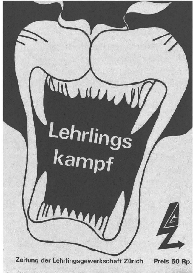
Couverture de Lehrlingskampf , n° 1, 1971, Zurich. Archives sociales suisses.

Parmi les groupes ad hoc organisés dans le cadre du Bunker, l'un s'occupe du problème des apprenti·e·s. En 1970, c'est en son sein que naît l'Organisation révolutionnaire des apprentis ( Revolutionäre Lehrlingsorganisation ), qui fait toutefois long feu, en raison de divergences idéologiques entre ses quelque 40 membres, et à laquelle participent certain·e·s des enquêté·e·s considéré·e·s ici. L'année suivante dans le sillage du Bunker est créée une structure plus ample, mais pas beaucoup plus durable : le Syndicat des apprentis ( Lehrlingsgewerkschaft Zürich ), le premier en Suisse, qui rassemble des personnes de différents courants, spontanéistes, marxistes-léninistes membres de la Revolutionäre Aufbauorganisation Zürich ou trotskistes appartenant