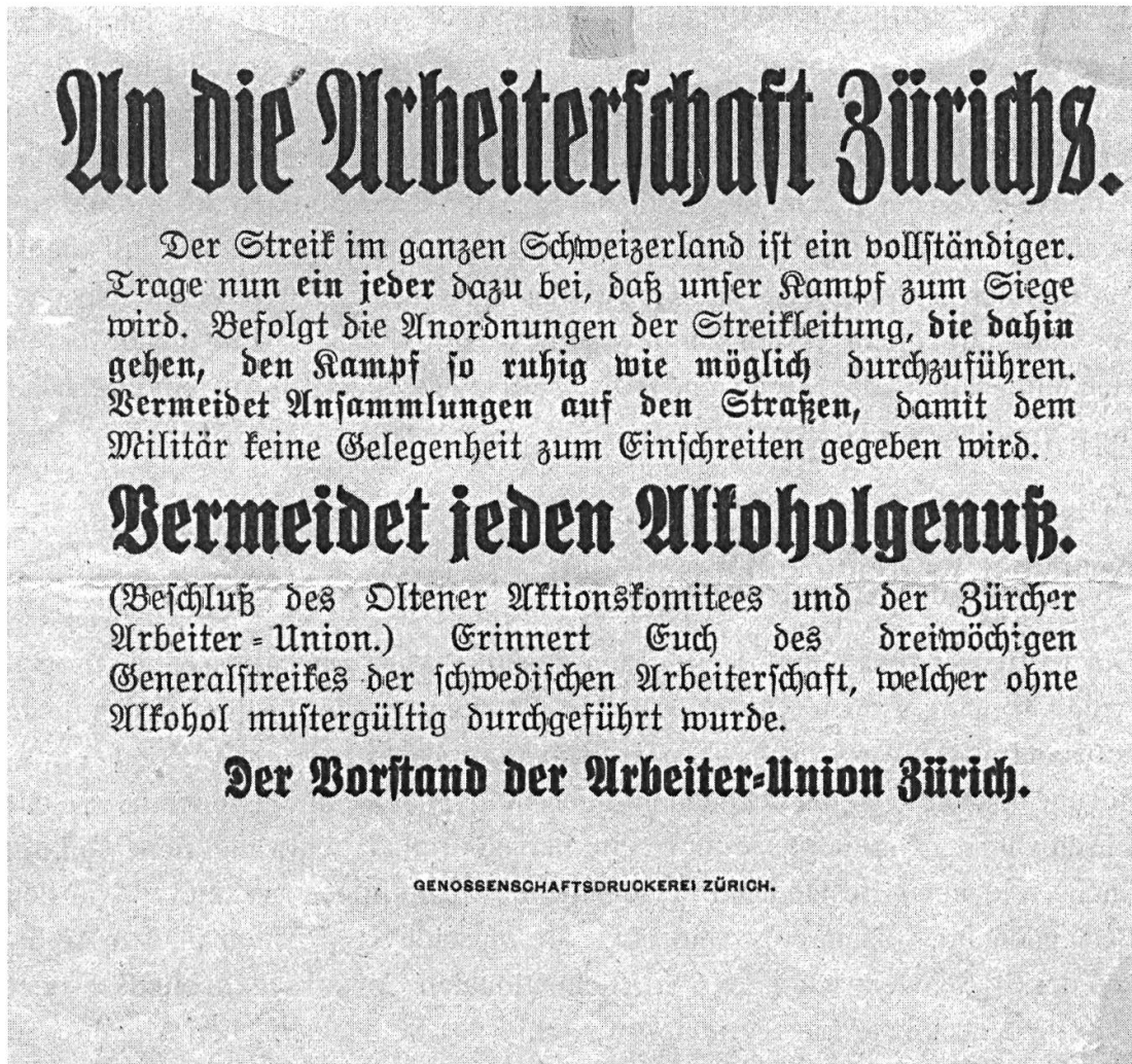
Aufruf der Zürcher Arbeiterunion zu Disziplin und Abstinenz während des Landesstreiks. Schweizerisches Sozialarchiv, 331/260-Z2.

ren zu den wenigen Quellen, die Aufschlüsse über Motivation und Verhalten der einzelnen Arbeiter an der Basis geben können. Im Archiv der SBB finden sich sowohl Unterlagen zum Bahnbetrieb während des Streiks als auch zum am Streik beteiligten Personal und zu den disziplinarischen Massnahmen. 9