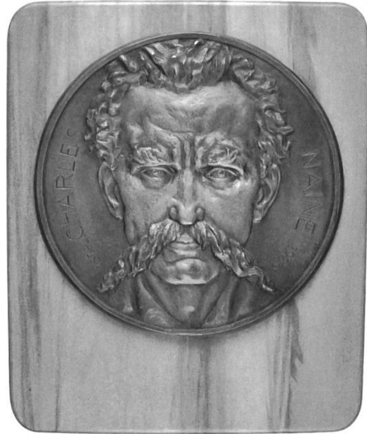
11. Charles Naine (plaque en bois sur bronze). Bibliothèque de la Ville de La Chaux-de-Fonds, Fonds Ernest-Paul Graber

Cette discrétion serait-elle le fruit du légendaire « consensus neuchâtelois » – à l'honneur dans les principales formations politiques de ce canton? À plusieurs reprises, il a été noté que les aspérités de l'histoire suisse sont évacuées du débat public 19 . Au sein de la gauche suisse, la conscience d'une critique de l'histoire dominante a reculé par rapport aux contributions (même imparfaites et critiquables) développées au début du XX e siècle par le dirigeant socialiste Robert Grimm 20 .