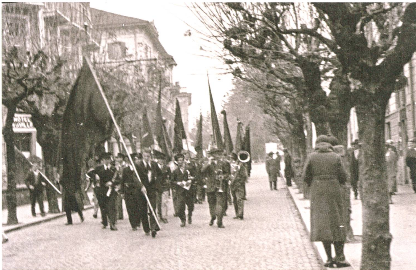
Manifestation de protestation contre la fusillade du 9 novembre 1932 à Genève, 20 novembre 1932, Bellinzona.

Auteur inconnu. Fondazione Pellegrini Canevascini, FPC_01719