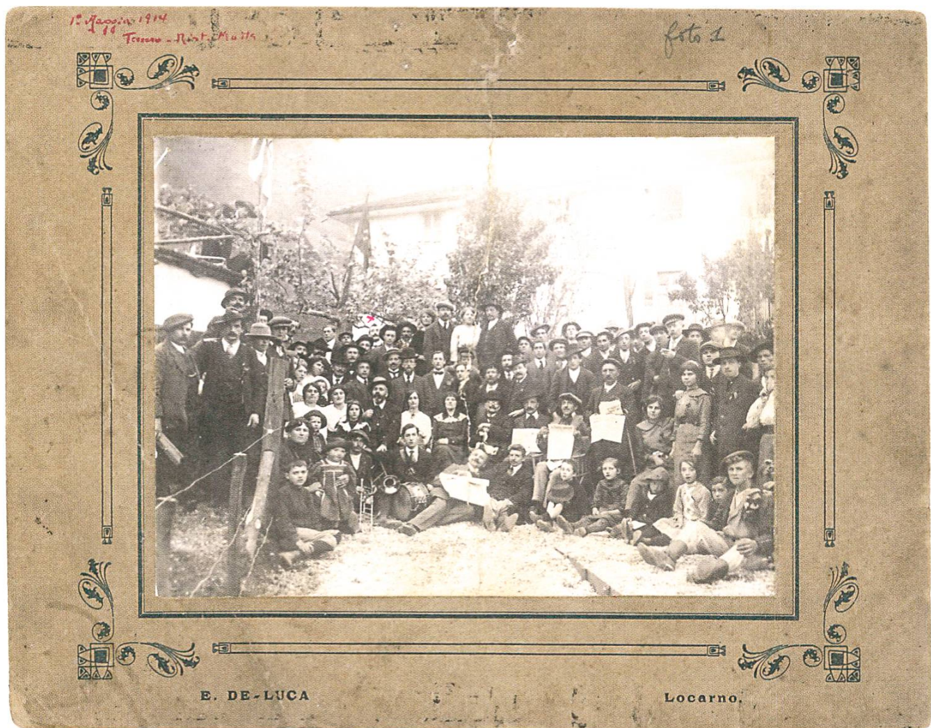
Portrait des participants au 1 er Mai 1914 à Tenero. FPC_06102

avec les modèles officiels et traditionnels. C'est le cas, par exemple, des portraits officiels de groupe, où la mise en scène et la composition du groupe sont ritualisées 7 .