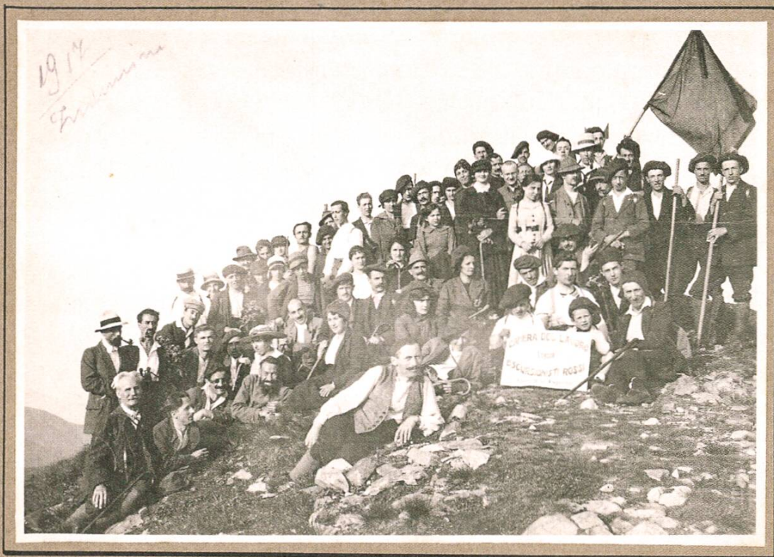
Portrait de groupe des Escursionisti Rossi au sommet du Monte Tamaro, 29 juin 1919. Auteur inconnu. Fondazione Pellegrini Canevascini, FPC_06272

permettant ainsi aux ouvriers d'accéder aux activités de loisirs et de temps libre. On voit donc se développer plusieurs initiatives, mouvements et associations de promotion de la pratique du sport, de la randonnée, de l'alpinisme et du scoutisme, ainsi que des colonies de vacances pour les enfants. Toutes ces pratiques de loisirs se trouvent représentées dans les photographies de la collection.