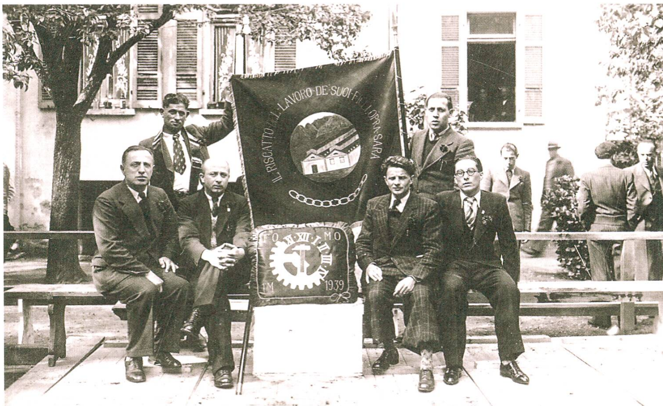
Portrait officiel de l'inauguration du drapeau de la FOMH de Bodio, 1939, Bodio.

des photographies de l'inauguration de son drapeau et d'en faire don au Comité central et aux différentes sections 9 . Cette décision est confirmée par le fait que dans la collection de la FPC se trouvent plusieurs exemplaires de ces clichés, sur lesquels figure souvent une inscription manuscrite au verso, avec des indications telles que «maçons de Biasca» ou «cheminots de Pollegio».