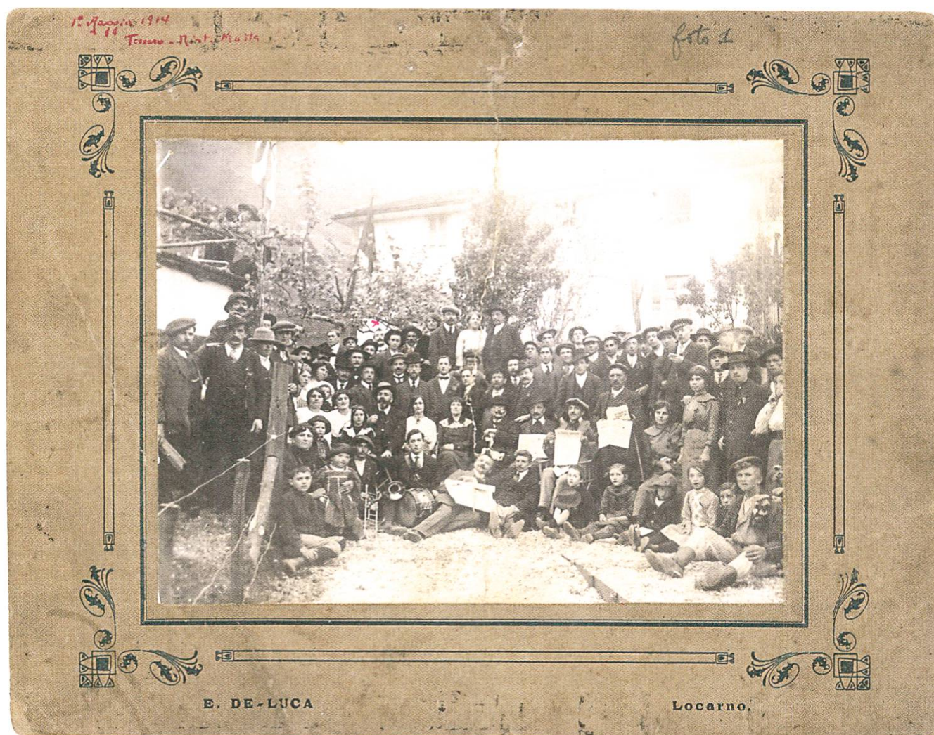
Portrait des participants au 1 er Mai 1914 à Tenero. E. De Luca. Fondazione Pellegrini Canevascini, FPC_06102

avec les modèles officiels et traditionnels. C'est le cas, par exemple, des portraits officiels de groupe, où la mise en scène et la composition du groupe sont ritualisées 7 .