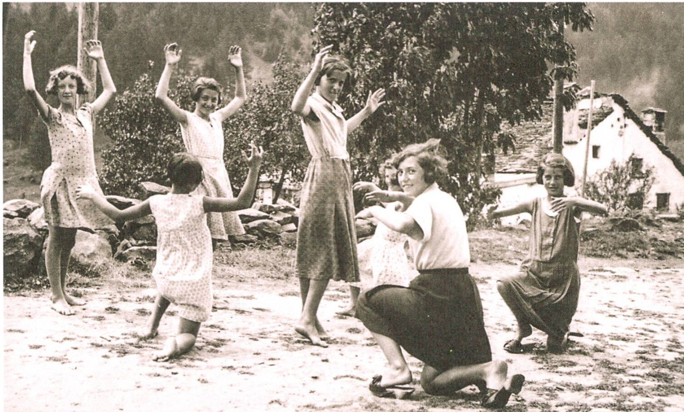
Chorégraphie d'un groupe de jeunes filles des Colonies de vacances des syndicats à Varenzo (Val Leventina), 1933.

Les congés payés et la journée de travail de huit heures deviennent une réalité dans les pays industrialisés lors de la première moitié du XX e siècle. Ces conquêtes sociales se diffusent également au Tessin,