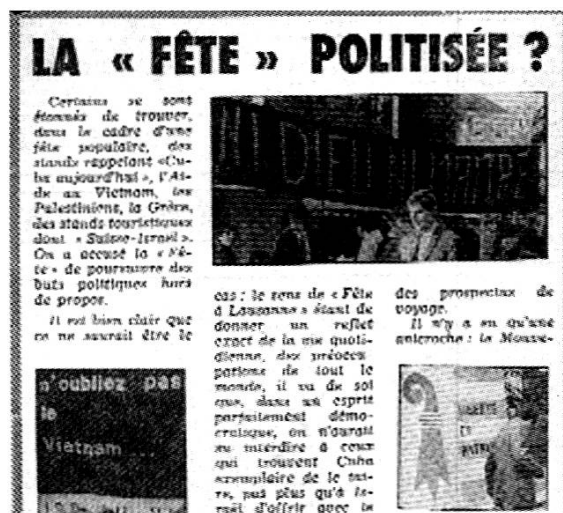
Lausanne, juin 1968: les anarchistes dans la rue

CIRA : correspondance (1957-se continue), rapports d'activités, réunions, publications, publications au sujet du CIRA, interviews audio et vidéo, expositions, conférences, débats.