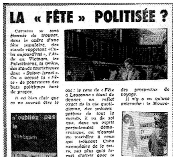
Lausanne, juin 1968: les anarchistes dans la rue

CIRA : correspondance (1957-se continue), rapports d'activités, réunions, publications, publications au sujet du CIRA, interviews audio et vidéo, expositions, conférences, débats.