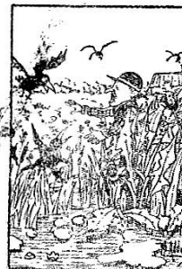
Ce qu'on y récolte