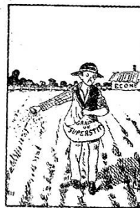
Ce qu'on y sème

L'école d'agriculture d'Ecône, instituée par le Saint-Bernard.