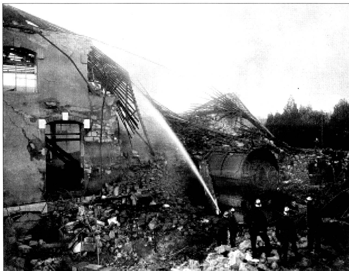
Genève, rue du Stand, août 1909.