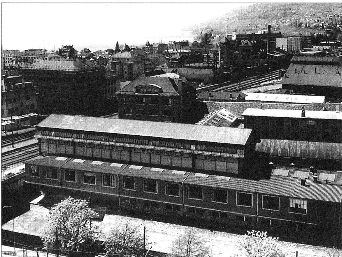
Vue générale des bâtiments situés entre la Veveyse et les rails CFF de la ligne du Simplon (négatif 6 x 6 N° 5669).

Les Ateliers de constructions mécaniques de Vevey (ACMV) sont nés de la fonderie fondée en 1842 par Benjamin Roy qui réparait des machines agricoles et fabriquait des roues de moulin. Dès les années 1870, les ACMV se mirent à diversifier leur production : machines pour le percement du tunnel du Gothard (1874), puis turbines hydro-électriques, tracteurs (les célèbres Vevey ), tram, charpentes métalliques, etc. Les ACMV furent modernisés en 1962, restructurés en 1986 (ramenés à 750 ouvriers), transformés en holding en 1989 et durent fermer leurs portes en 1992. La construction de matériel ferroviaire sera seule poursuivie à Villeneuve sous la raison sociale de Vevey Technologies SA . Les archives de l'entreprise n'ont à notre connaissance pas été conservées... mais, grâce au photographe veveysan Edouard Curchod, des milliers de clichés sur verre et des épreuves sur papier provenant des bureaux de l'entreprise ont été sauvés de la destruction, permettant aujourd'hui de retracer par l'image l'histoire des ACMV.