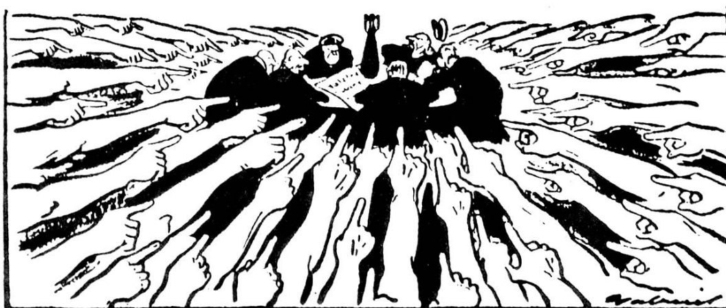
Les stratèges américains devant le succès de l'appel de Stockholm : « Bon Dieu ! Où allons-nous aller faire la guerre à présent ? »

Une fonction particulière est assignée par le mouvement communiste mondial à ce vaste rassemblement des "partisans de la paix" (dont l'intégrité et la sincérité - même si elles s'accompagnèrent parfois d'une grande dose de naïveté - ne sont évidemment pas en cause). Ce mouvement pacifiste des années 50 est tourné - faut-il le dire? - exclusivement contre l'impérialisme américain. L'Appel de Stockholm (1950) contre la bombe atomique - la supériorité nucléaire américaine est alors écrasante - en marque l'apogée. Savants (Einstein, Joliot-Curie...), artistes et écrivains (Gérard Philippe, Yves Montand, Jean Marais, Thomas Mann...), pasteurs et socialistes chrétiens (Arthur Maret, le pasteur Niemöller...), sportifs comme Zatopek, "compagnons de route" du Parti et naturellement militants (Maurice Thorez, le "fils du peuple", n'est-il pas aussi "L'homme de la paix" ?) sont mobilisés. A l'apocalypse nucléaire dont les impérialistes yankees menacent le monde, on oppose l'atome au service de la paix (12). La V.O. ne cesse de souligner les inlassables efforts soviétiques en faveur du désarmement mondial (13), imprégnant les esprits d'une conception claire, simple et manichéenne du monde. Comme le fait d'ailleurs, mais dans l'autre sens, toute la presse bourgeoise des années 50!