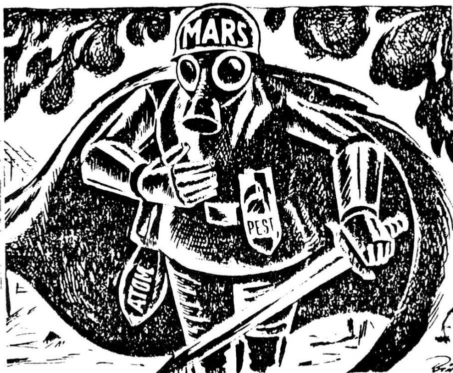
Le dieu du grand capital est prêt Eisenhower, avant son élection, avait déclaré : « Si le suédois élu, je demanderais l'aide de Dieu. » (Dessin : Holger Rindrup, Land og Folk.)

La campagne s'accroît en 1953. En juin, tous les jours un article appelle à la mobilisation populaire pour sauver les époux Rosenberg. En vain.