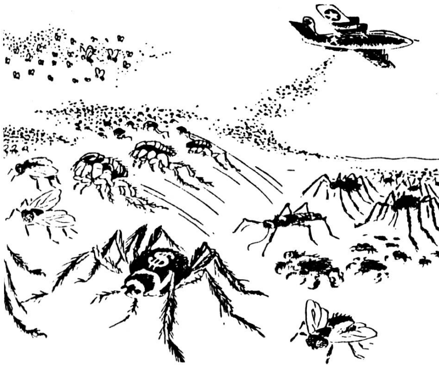
Punaises, mouches, poux, les valeureux combattants de l'Amérique pour la peste et le choléra en Corée et en Chine (Dessin de Herluf Bildstrup, -Land og Folk.)

(10 avril 1952). Et en effet, les agents de la police municipale confisquèrent, à la sortie des écoles, ces petites images qui n'avaient rien à faire dans les mains de jeunes enfants. Le thème de la "guerre bactériologique" (elle ne fut jamais prouvée), amena à une formidable mobilisation antiaméricaine, qui culmina en France avec les manifestations contre "Ridgway la peste", où les affrontements