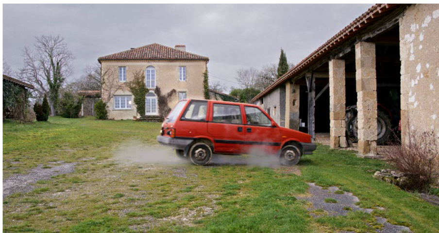
La remota granja de Gascuña no es un lugar de vida adecuado para personas mayores.

Aunque “Wir Erben” es una película radicalmente personal, no deja de plantear cuestiones de alcance universal: ¿Qué nos hace ser quienes somos y por qué? ¿Cómo manejamos las expectativas ajenas?