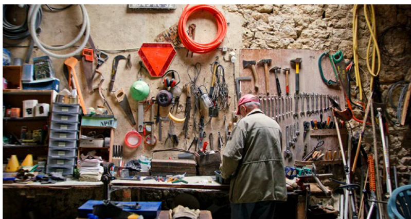
A Ruedi Baumann (aquí en su taller) le gustaría que la granja permaneciera en manos de la familia.

Aunque “Wir Erben” es una película radicalmente personal, no deja de plantear cuestiones de alcance universal: ¿Qué nos hace ser quienes somos y por qué? ¿Cómo manejamos las expectativas ajenas?