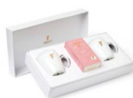
"It's tea time!": juego de té, de Sirocco