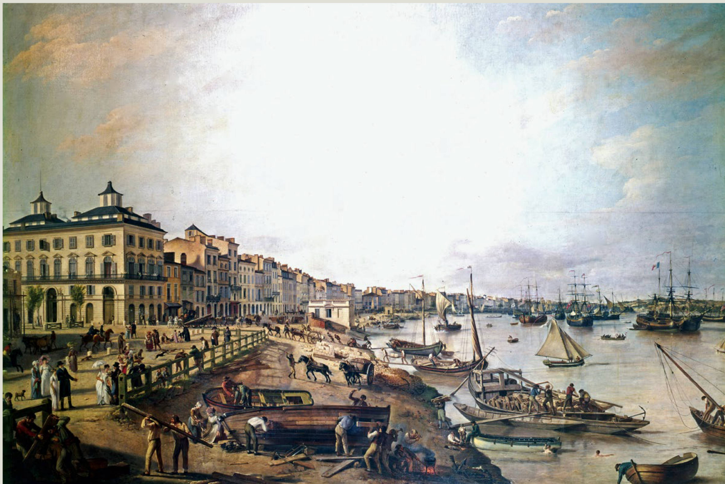
La ciudad portuaria francesa de Burdeos, con acceso indirecto al Atlántico, fue un importante centro del comercio internacional y de la emigración europea a ultramar. Este cuadro del pintor Pierre Lacour data de 1806.

Si una ciudadana suiza pierde sus documentos en Cuba, acude al consulado. Cuando una pareja suiza trae un hijo al mundo en Australia o un suizo requiere asistencia en Kenia, también acuden a la representación suiza local. Todos pueden contar con una red cuyos orígenes se remontan a mucho tiempo atrás: el primer consulado suizo se abrió en Burdeos, en 1798.