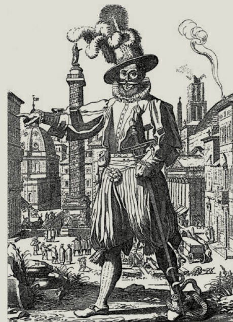
Un oficial de la Guardia Suiza en un grabado de Francisco Villamena (1613): sus rasgos básicos apenas han cambiado.

No todo el mundo puede pertenecer a la Guardia. Para entrar en el cuerpo hay que ser católico practicante, ciudadano suizo, varón, soltero, tener entre 19 y 30 años, medir al menos 174 cm, gozar de buena salud, haber cursado un aprendizaje profesional o el bachillerato, haber terminado la escuela