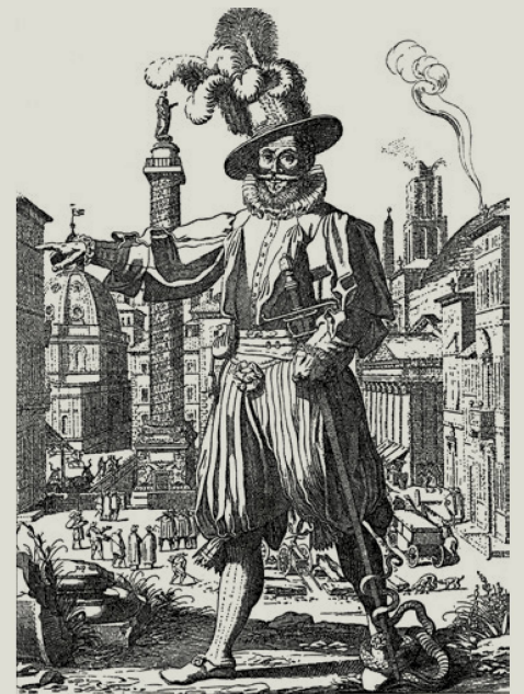
Un oficial de la Guardia Suiza en un grabado de Francisco Villamena (1613): sus rasgos básicos apenas han cambiado.

No todo el mundo puede pertenecer a la Guardia. Para entrar en el cuerpo hay que ser católico practicante, ciudadano suizo, varón, soltero, tener entre 19 y 30 años, medir al menos 174 cm, gozar de buena salud, haber cursado un aprendizaje profesional o el bachillerato, haber terminado la escuela