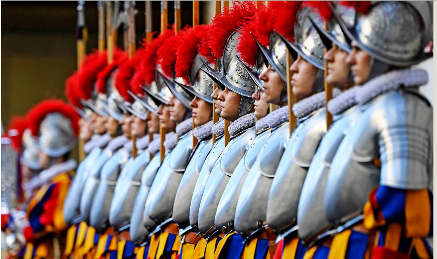
Los uniformes de la Guardia Suiza lucen suntuosos colores. Se inspiran en la indumentaria renacentista y, en particular, en los frescos del pintor Rafael.

de reclutas, poseer el carné de conducir de automóvil categoría B y estar dispuesto a comprometerse durante 26 meses de servicio. Esto convierte a la Guardia Suiza en la comunidad suiza en el extranjero más homogénea del mundo. Sin embargo, no hay que olvidar que, además de los 135 guardias, viven en el Vaticano otros 25 ciudadanos suizos. La mayoría de ellos son familiares de los guardias suizos, aunque algunos son miembros del clero. Otra particularidad de la comunidad suiza en el Vaticano es que todos los que trabajan en o para el Vaticano disfrutan de la ciudadanía vaticana mientras dure su empleo. Esto significa que los guardias obtienen rápidamente la ciudadanía, aunque solo por tiempo limitado. La forma de gobierno del Vaticano también es especial: es la única monarquía absoluta electiva. La Santa Sede tiene estatuto de observador en la ONU. Mantiene relaciones diplomáticas con más de 180 países, de los cuales más de 90 tienen representación local. Con más de 1 300 millones de creyentes y una amplia red mundial, la Santa Sede tiene un poder político tan grande como pequeño es su territorio.