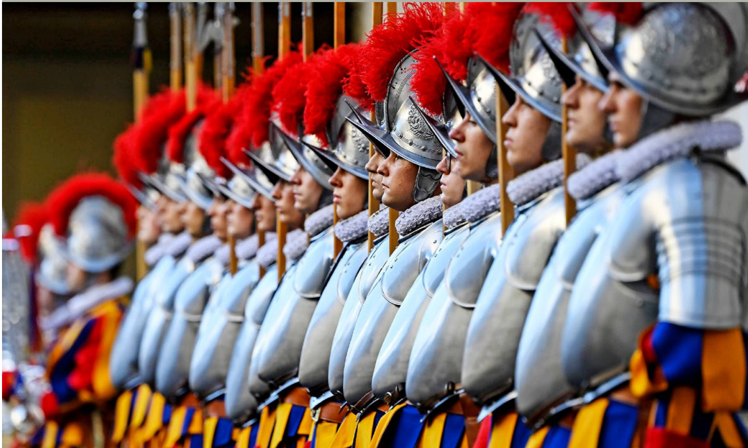
Los uniformes de la Guardia Suiza lucen suntuosos colores. Se inspiran en la indumentaria renacentista y, en particular, en los frescos del pintor Rafael.

de reclutas, poseer el carné de conducir de automóvil categoría B y estar dispuesto a comprometerse durante 26 meses de servicio. Esto convierte a la Guardia Suiza en la comunidad suiza en el extranjero más homogénea del mundo. Sin embargo, no hay que olvidar que, además de los 135 guardias, viven en el Vaticano otros 25 ciudadanos suizos. La mayoría de ellos son familiares de los guardias suizos, aunque algunos son miembros del clero. Otra particularidad de la comunidad suiza en el Vaticano es que todos los que trabajan en o para el Vaticano disfrutan de la ciudadanía vaticana mientras dure su empleo. Esto significa que los guardias obtienen rápidamente la ciudadanía, aunque solo por tiempo limitado. La forma de gobierno del Vaticano también es especial: es la única monarquía absoluta electiva. La Santa Sede tiene estatuto de observador en la ONU. Mantiene relaciones diplomáticas con más de 180 países, de los cuales más de 90 tienen representación local. Con más de 1 300 millones de creyentes y una amplia red mundial, la Santa Sede tiene un poder político tan grande como pequeño es su territorio.