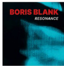
BORIS BLANK: "Resonance" (Universal, 2024)

El anuncio del tercer álbum en solitario de Boris Blank era todo menos prometedor: ¿cómo podía el mago de los sintetizadores de Yello, considerado durante décadas como uno de los principales pioneros de la música electrónica, atreverse ahora a componer un álbum para balnearios? ¿Música para escuchar en medio del vapor de eucalipto de la sauna mixta, alternando con el gorjeo de aves tropicales?