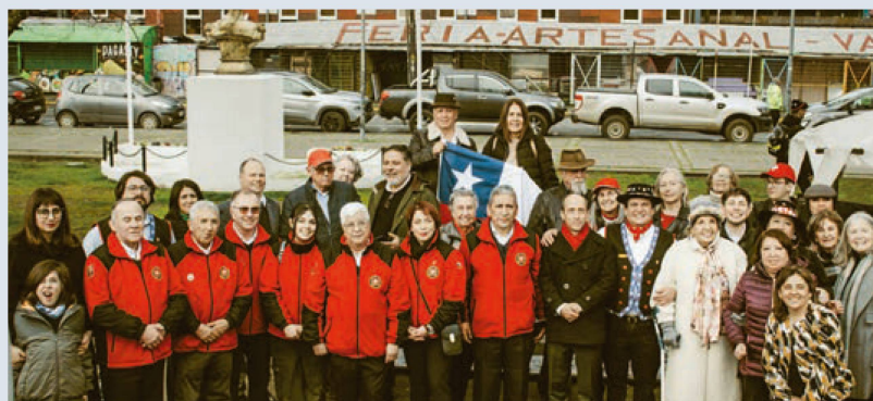
Participantes de la celebración del 1° de agosto

Club Suizo de Temuco, representantes del Club Suizo de Osorno y de la localidad Lacustre de Villarrica, socios del Club Suizo de Valdivia, compatriotas