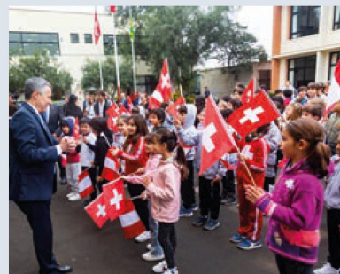
Consejero Federal Ignazio Cassis con los alumnos del Colegio Pestalozzi

Ignacio Cassis también participó en la inauguración de una exposición que celebra el 140 aniversario de las relaciones diplomáticas entre Suiza y Perú. En la noche, la comunidad suiza y las autoridades locales se reunieron en un gran evento en la residencia del Embajador