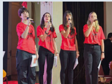
Alumnos del instituto Línea Cuchilla en la interpretación de los himnos nacionales de Argentina y Suiza