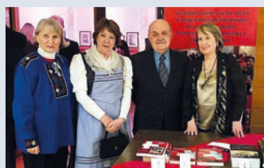
Presentación de los libros del Taller Literario

desarrolló este festejo que contó con presentaciones artísticas, entretenidos bingos y diversos stands de comida suiza con las tradicionales salchichas y raclette.