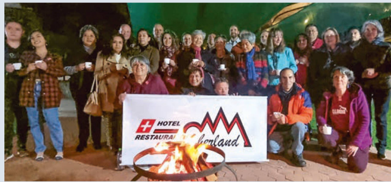
Festejo 1° de agosto