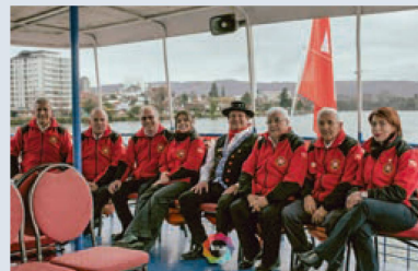
Integrantes de la Sexta Bomba Suiza de Río Bueno