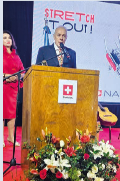
El Embajador de Suiza se dirige a los presentes