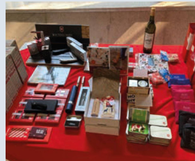
Artículos suizos para los asistentes