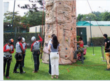
Pared de escalada y demostración de la Asociación de Guías de Montaña

El respaldo generoso de empresas suizas y peruanas como Nestlé, QSI, Kuna, Tiyapuy, Aje, Casa Andina y Civa, contribuyó al éxito de esta celebración única, consolidándola como un hito cultural y social en el calendario de eventos de Lima.