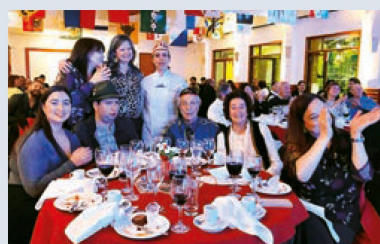
Socios y amigos del Club Suizo