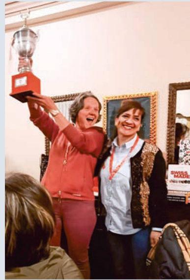
Ganadora del Trofeo del Jass