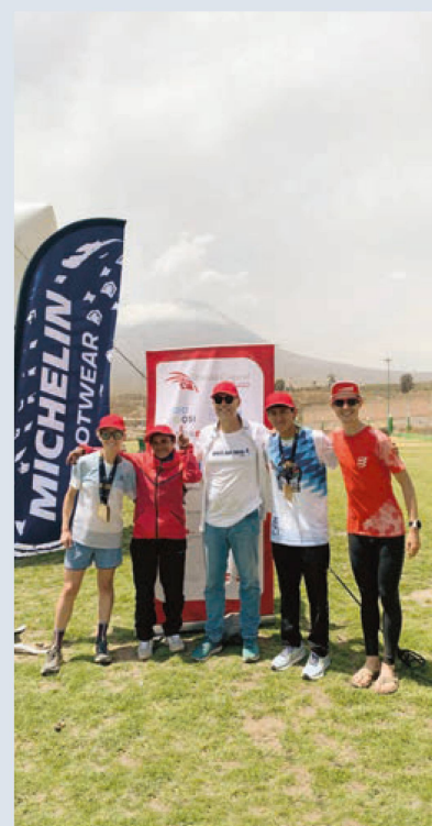
Atletas suizos y peruanos en la carrera Misti Sky Race 2023 en Arequipa, Perú