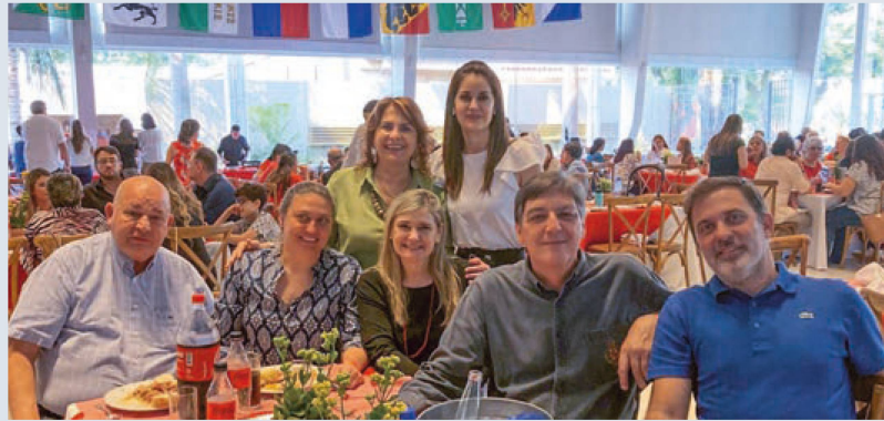
Asistentes al almuerzo

Durante el almuerzo de celebración realizado en Asunción, se sirvie-