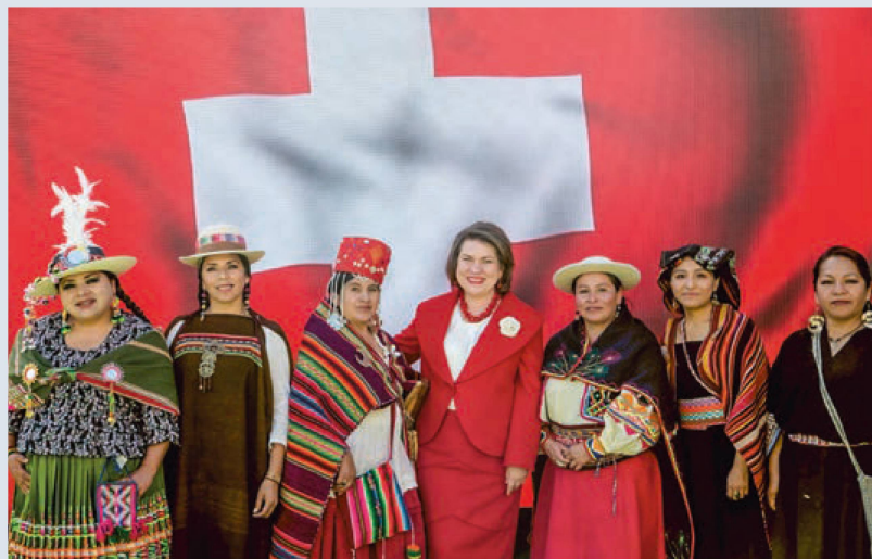
Sra. Embajadora con el grupo de Música Folclórica Inalmama Sagrada Coca

La Embajadora cerró el acto oficial con un brindis y la entrega de una placa en conmemoración de la joya arquitectónica del edificio de la Embajada de Suiza, construido en 2003 y que recibió el Premio de Cultura de la ciudad La Paz en el mismo año. Su mensaje: “Nuestra dinámica de coope-