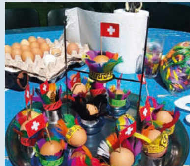
Huevos de Pascua decorados