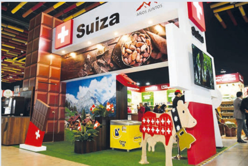
Salón del Cacao y del Chocolate

Suiza fue el país invitado en la 15ª edición del Salón del Cacao y del Chocolate, el principal evento de este sector en Perú, que cuenta con el Salón del Chocolate de París como socio estratégico.