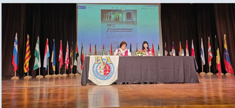
Presentación de FASRA y EVA