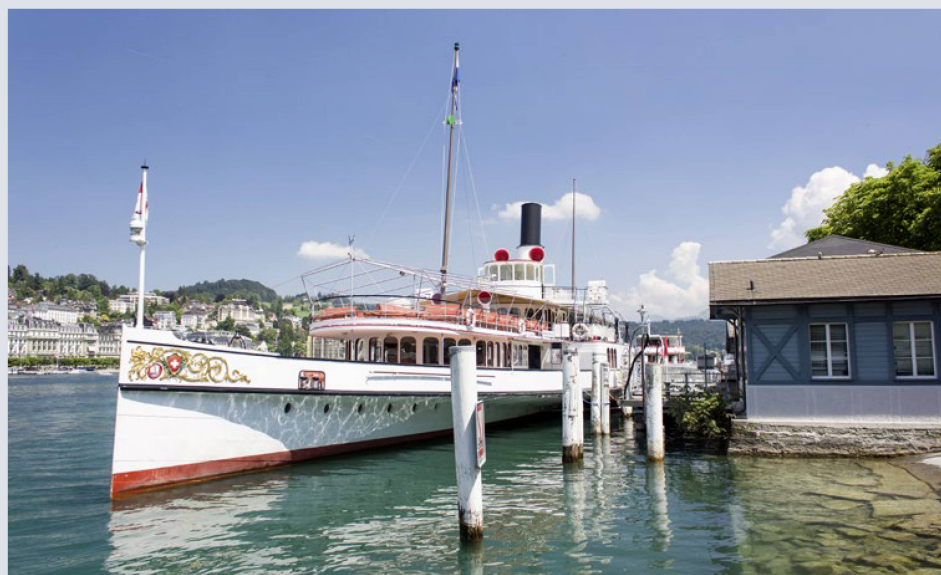
Los barcos son parte de Lucerna: el histórico barco de vapor “Uri”, en el Bahnhofquai.