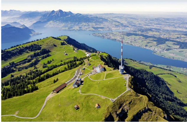
Foto aérea del Rigi con vistas al lago de los Cuatro Cantones, al monte Pilato y a la meseta de Lucerna.

ción activa de más de sesenta jóvenes suizos del extranjero que se unirán a nosotros procedentes de los campamentos de verano, y estará marcado por la presencia de un miembro del Gobierno suizo y la participación del mundo empresarial y la comunidad