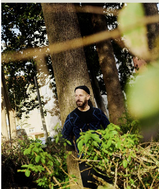
Uriel Orlow, Gran Premio Suizo de Arte / Prix Meret Oppenheim, 2023.

dial para los libros suizos y una oportunidad para mostrar la calidad del diseño de libros en Suiza.