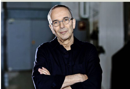
Jossi Wieler, Gran Premio Suizo de Teatro / Hans-Reinhart-Ring 2020.