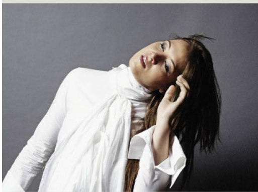
Sophie Hunger.

Los éxitos internacionales de los cinematógrafos suizos subrayan la diversidad cultural y la capacidad de los suizos para contar historias que despiertan interés en todo el mundo.