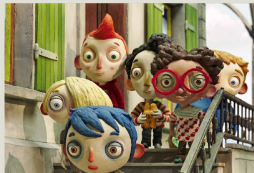
“La vida de Calabacín” ganó el premio a la mejor película de ficción en los Swiss Film Awards de 2017 y fue nominada como mejor película animada en los Óscars.

La fundación suiza para la cultura Pro Helvetia promueve la divulgación de obras y proyectos de artistas suizos en el extranjero mediante su apoyo a eventos, proyectos y traducciones. Esto incluye la financiación de presentaciones públicas, la realización de eventos promocionales para organizadores internacionales, la participación en ferias especializadas y eventos de networking, el apoyo a la presencia de Suiza (por ejemplo, en la Bienal de Venecia o en el Festival de Teatro de Aviñón), así como la facilitación de material de promoción. Sus seis oficinas de enlace en El Cairo, Johannesburgo, Moscú, Nueva Delhi, Shanghái y Sudamérica mantienen contactos con instituciones culturales y socios locales, actúan como intermediarias en estas regiones y ofrecen programas de residencia, investigación e intercambio que ayudan a los creadores suizos de arte y cultura a establecerse y tejer una red internacional de contactos.