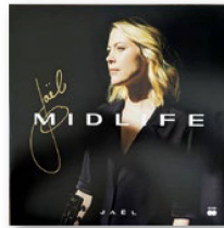
JAËL: “Midlife”. Phonag, 2023.

A Jaël la persigue su pasado musical. Siempre que publica un nuevo álbum en solitario, muchos de sus fans esperan un regreso a sus raíces, una obra que suene como el trip-hop de lo que fuera su exitosa banda: Lunik.