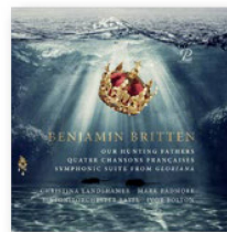
BENJAMIN BRITTEN Our Hunting Fathers Quatre Chansons françaises, Symphonic Suite from Gloriana Prospero Classical 2022

Basilea es, sin duda, una ciudad artística. Pero es, ante todo, una ciudad musical, pues no menos de cuatro orquestas municipales tocan al más alto nivel internacional: La Cembra está especializada en el barroco; la Basel Sinfonietta, en música de vanguardia y la Orquesta de Cámara de Basilea toca un poco de todo; por último, la Orquesta Sinfónica de Basilea se centra en obras sinfónicas de gran prestigio.