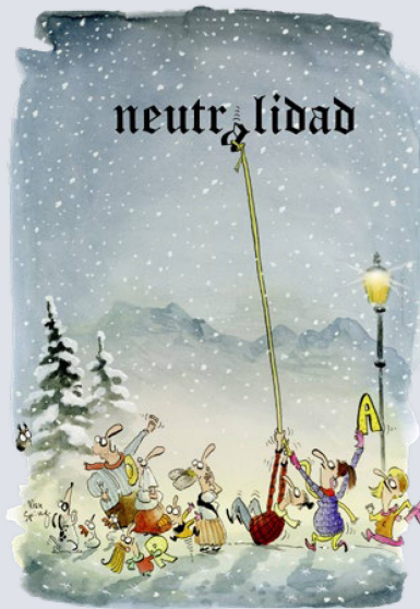
Luchando por la neutralidad “correcta”. Caricatura de Max Spring

El Consejo de los Suizos en el Extranjero no se limita a fijar su postura. También plantea exigencias al Gobierno nacional. Exige que el Consejo Federal siga “una política de