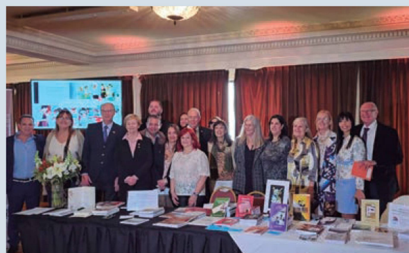
Muestra de Libros