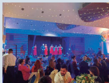
Grupo de baile “Flor de los Alpes”