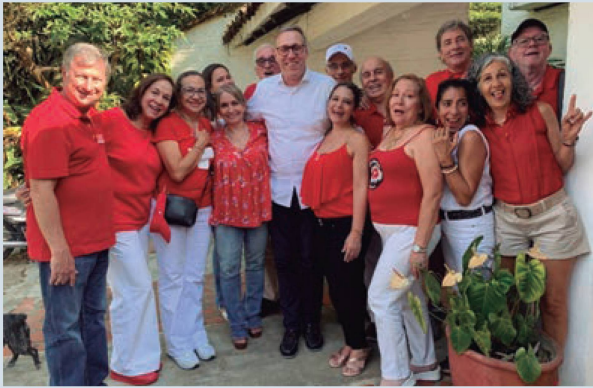
Celebración en Medellín La comunidad suiza en el evento celebrado en Cali