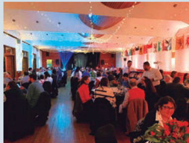
Salón Club Suizo de Santiago