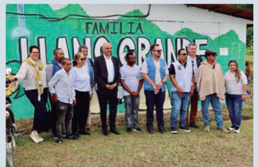
Presidente Alain Berset y Presidente de Colombia Gustavo Petro