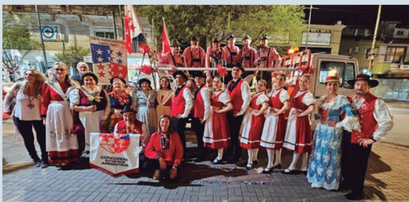
Orquesta Lustige Musikanten, Ballet Edelweiss, trajes típicos suizos