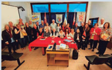
Reunión de E.V.A.