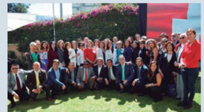
Colaboradoras/es y excolaboradoras/es de la Embajada y Cooperación Suiza en Bolivia.