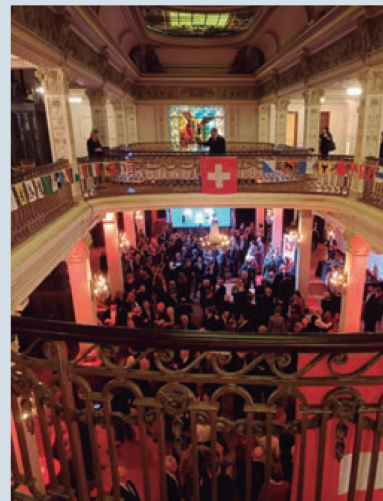
Palacio San Miguel

Previo al evento, ya se había realizado el anuncio de los premios y menciones y los ganadores fueron agasajados en la sede de la CCSA con la presencia de las autoridades de la organización y del Embajador Bortis.