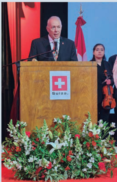
Embajador de Suiza Hans-Ruedi Bortis

Allí, el presidente de la CCSA destacó la importancia del concurso y la exitosa convocatoria, que en 2023 superó los 100 participantes.