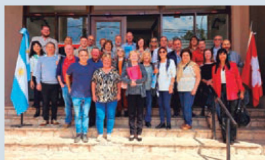
Reunión de F.A.S.R.A.