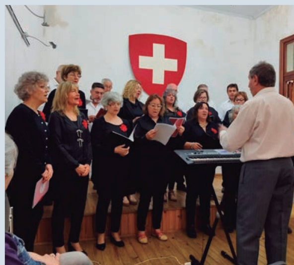
Coro Suizo-Festejo del 1º de agosto en la sede social

El entusiasta aplauso de los asistentes festejó y agradeció el concierto para luego compartir un brindis en el hall de la entidad cerrando este tradicional festejo helvético que se realiza en muchísimos sitios para celebrar la Fiesta Nacional de Suiza.