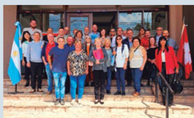
Reunión de F.A.S.R.A.