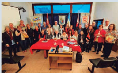
Reunión de E.V.A.