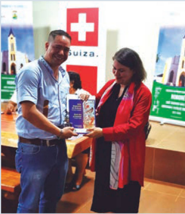
La Embajadora de Suiza Dra. Edita Vokral, entrega el libro "Arte Rupestre de Roboré"

del cual se registraron un total de 70 sitios de arte rupestre; se estima que algunos de ellos datan de 6.500 a.C.