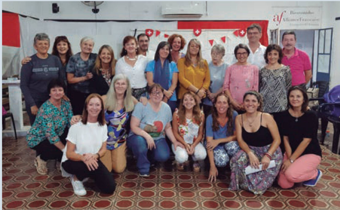
Docentes, estudiantes y miembros de instituciones que participaron en el Encuentro