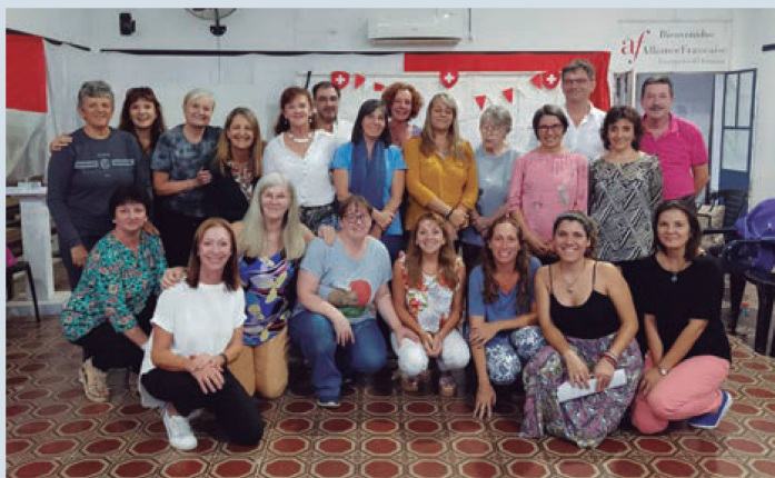
Docentes, estudiantes y miembros de instituciones que participaron en el Encuentro