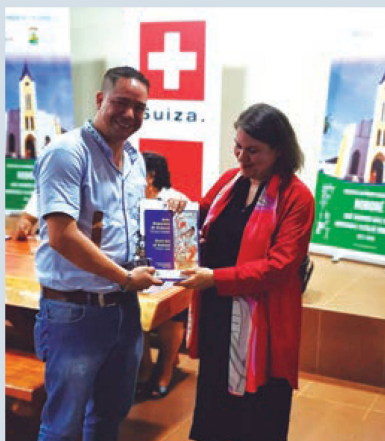
La Embajadora de Suiza Dra. Edita Vokral, entrega el libro "Arte Rupestre de Roboré"

del cual se registraron un total de 70 sitios de arte rupestre; se estima que algunos de ellos datan de 6.500 a.C.