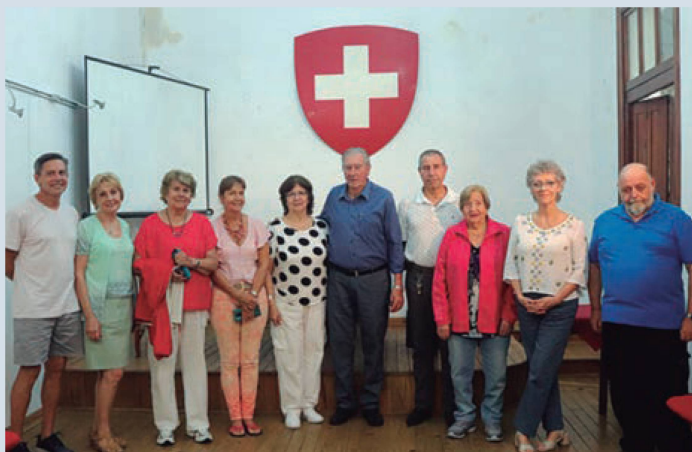
Integrantes de la Comisión Directiva y docentes de la Sociedad Suiza de Paysandú