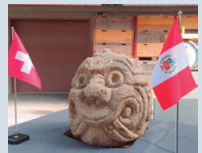
Cabeza clava de la Cultura Chavín

En 2016, Suiza firmó un acuerdo bilateral con Perú para prevenir el tráfico ilícito de bienes culturales, gracias al cual la colaboración cultural entre Suiza y Perú es muy activa. La Embajada de Suiza en Perú apoya la protección y restauración del patrimonio presente en territorio peruano con proyectos de exhibición y conservación, con los siguientes actores: MALI Museo de Arte de Lima, Zona Arqueológica de Caral y la Universidad Nacional Mayor de San Marcos.