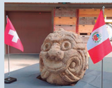
Cabeza clava de la Cultura Chavín

En 2016, Suiza firmó un acuerdo bilateral con Perú para prevenir el tráfico ilícito de bienes culturales, gracias al cual la colaboración cultural entre Suiza y Perú es muy activa. La Embajada de Suiza en Perú apoya la protección y restauración del patrimonio presente en territorio peruano con proyectos de exhibición y conservación, con los siguientes actores: MALI Museo de Arte de Lima, Zona Arqueológica de Caral y la Universidad Nacional Mayor de San Marcos.