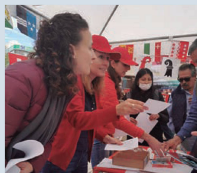
El stand suizo en el Pueblo de la Francofonía