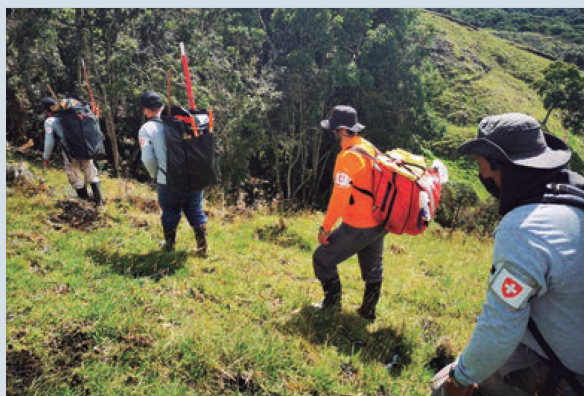
Algeciras: trabajar por una Colombia libre de minas antipersonas

La firma del Acuerdo de Paz en 2016 entre el Gobierno colombiano y las Fuerzas Armadas Revolucionarias de Colombia FARC-EP, marcó un nuevo capítulo en la historia de Colombia. Uno de los pilares de este Acuerdo, es el Sistema Integral de Paz. El trabajo de las instituciones que lo inte-