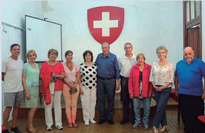
Integrantes de la Comisión Directiva y docentes de la Sociedad Suiza de Paysandú