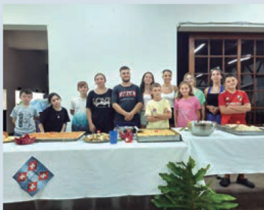
Taller de cocina