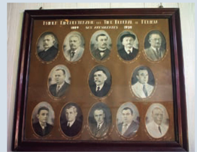
Año 1939: A 50 años de su fundación

En el marco del Encuentro Cultural “Suiza, ayer y hoy en Argentina”, organizado por la Federación de Asociaciones Suizas de la República Argentina FASRA y Entidades Valesanas Argentinas EVA, los días 30 de septiembre y 1º de octubre de 2022, se presentó el libro “Recetas de nuestras abuelas suizas”, un proyecto de EVA que se gestó durante la pandemia y mantuvo activas y creativas a las asociacio-