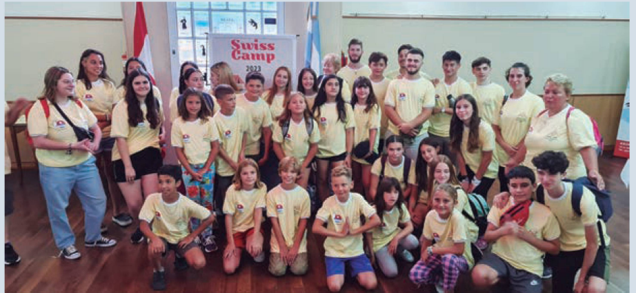
Santa Fe: la partida hacia una gran experiencia