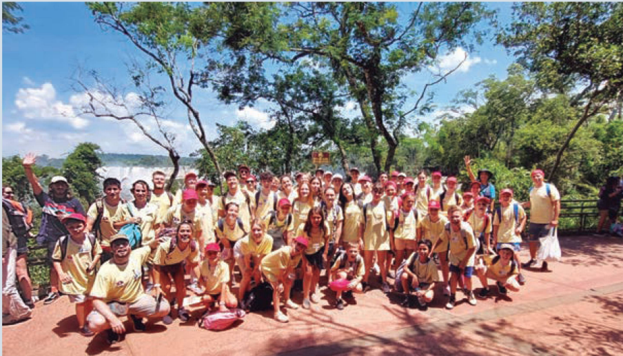
Visita a las Cataratas del Iguazú