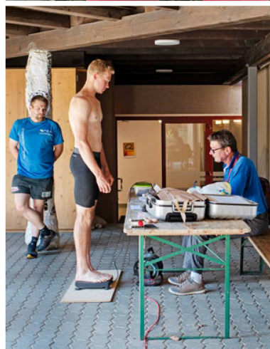
Antes del torneo se comprueba el peso de cada equipo.