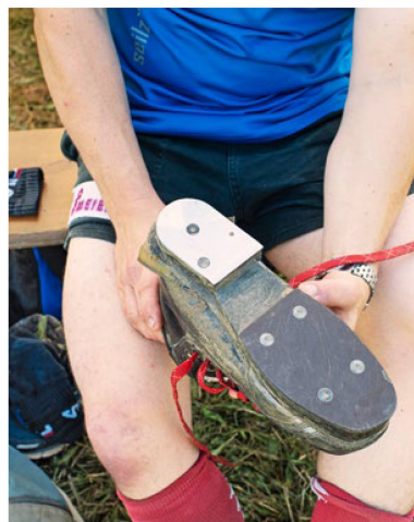
Zapatos especiales para tirar de la soga: se permite una placa metálica en el talón.