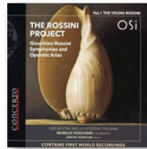
ORCHESTRA SVIZZERA ITALIANA The Rossini Project: Vol. II, The Young Rossini, Concerto Classics 2020 Rossini: Symphonies and Operatic Arias, Concerto Classics 2018

Quien llegue de Zúrich para asistir a un concierto en Lugano seguramente se preguntará –y no solo durante el entreacto, mientras tome una bocanada de aire fresco y contemple las estrellas fugaces que caen sobre el monte San Salvatore iluminado por la luna– por qué los conciertos en esta ciudad le producen siempre esa sensación de ligereza. Más que recurrir a manidos clichés mediterráneos o al eterno ambiente vacacional del Tesino, busquemos el motivo en la hora de inicio del concierto: las 20:30 h. Esto permite cenar en una pizzería tras salir de la oficina o tomarse una copa de vino en la piazza . Así, todo el mundo llega al concierto relajado, fresco y alegre.