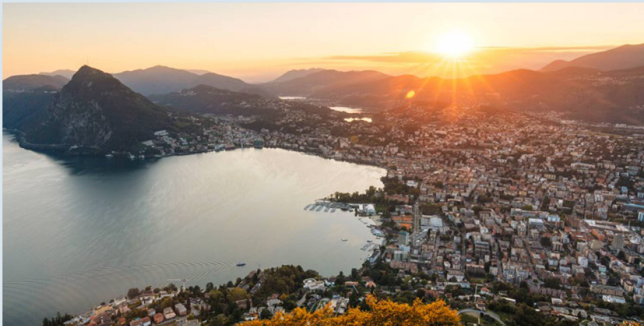
Un marco encantador para el Congreso: el ambiente vespertino del "Golfo de Lugano".

¿Qué retos plantean los grandes temas de hoy al sistema democrático suizo? En torno a esta pregunta de candente actualidad girará el Congreso de los Suizos en el Extranjero, que se celebrará los días 19 y 20 de agosto de 2022, en Lugano. A los participantes en el Congreso no les faltará material de debate.