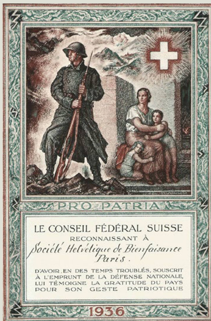
Un documento histórico de un periodo turbulento: en 1936, el Consejo Federal agradeció a la Sociedad Helvética de Beneficencia de París por su compromiso y expresó "la gratitud del país por su gesto patriótico".