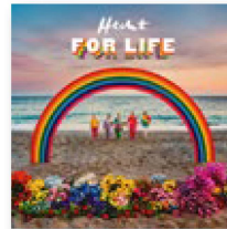
HECHT: "Hecht for Life". Gadget, 2022.

Colores chillones hasta donde alcanza la vista, sonidos en consonancia, eterna juventud: con su llamativa estética, Hecht es el grupo de moda en la Suiza alemana. Cuatro años después de su último y exitoso álbum Oh Boy , ahora con su nueva pieza estos lucernenses vuelven a deleitar a su público mayoritariamente joven, catapultándose a la cima de los grandes éxitos. Y en noviembre, cereza sobre el pastel: para coronar su gira, el quinteto dará un concierto en el Hallentadion de Zúrich.