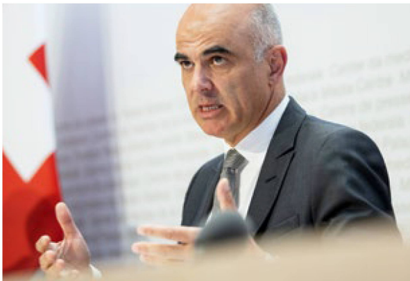
El Ministro de Salud, Alain Berset, considera el rotundo “Sí” una muestra de aprecio y agradecimiento al personal de enfermería.

En caso de prevalecer este procedimiento de dos vías, el Consejo Federal tendrá que concretar las demás demandas en un plazo de 18 meses, mostrando en particular cómo lograr que el personal sanitario esté más satisfecho en el día