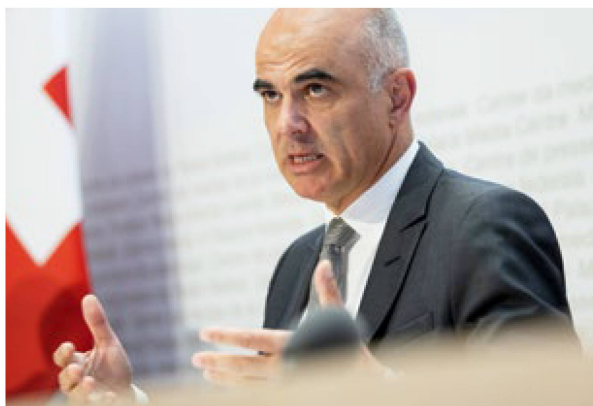
El Ministro de Salud, Alain Berset, considera el rotundo “Sí” una muestra de aprecio y agradecimiento al personal de enfermería.

En caso de prevalecer este procedimiento de dos vías, el Consejo Federal tendrá que concretar las demás demandas en un plazo de 18 meses, mostrando en particular cómo lograr que el personal sanitario esté más satisfecho en el día