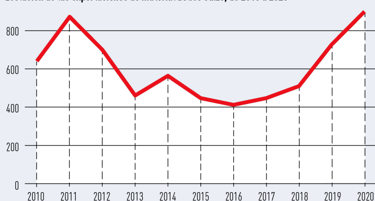
Evolución de las exportaciones de material bélico suizo, de 2010 a 2020

representa los intereses de los productores de armas. A mediano plazo, la industria armamentística acabará por abandonar Suiza, presagia Zoller, quien destaca la competencia de la Unión Europea. La UE está invirtiendo 8 000 millones de euros en un programa para la implantación de la industria de armamento: “Allí las empresas suizas son bienvenidas en todo momento”. El futuro régimen de exportación ya no permitirá exportar a países involucrados en un conflicto armado. “Con una interpretación restrictiva, que es lo que cabe esperar, ya no podríamos exportar a EE. UU., Francia o Dinamarca”, advierte Zoller. Por ello espera que la Confederación se comprometa con este sector para que sigan “siendo posibles la exportación y la cooperación con los países amigos”.