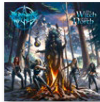
BURNING WITCHES: "The Witch of the North" Nuclear Blast, 2021

No puede afirmarse que hayan reinventado el género. Todo lo contrario: Burning Witches representa un heavy metal hipertradicional, por no decir anticuado. Pero estas suizas tienen más de un as bajo la manga. Por un lado, en el grupo hay solo mujeres, algo todavía infrecuente en el metal y que, por ello mismo, llama la atención. Además, saben venderse de forma muy inteligente: se presentan como heroínas de fantasía, guerreras o brujas, es decir, mujeres fuertes que, además de ser bellas, también son peligrosas.