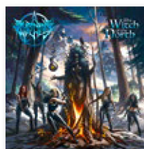
BURNING WITCHES: "The Witch of the North" Nuclear Blast, 2021

No puede afirmarse que hayan reinventado el género. Todo lo contrario: Burning Witches representa un heavy metal hipertradicional, por no decir anticuado. Pero estas suizas tienen más de un as bajo la manga. Por un lado, en el grupo hay solo mujeres, algo todavía infrecuente en el metal y que, por ello mismo, llama la atención. Además, saben venderse de forma muy inteligente: se presentan como heroínas de fantasía, guerreras o brujas, es decir, mujeres fuertes que, además de ser bellas, también son peligrosas.