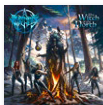
BURNING WITCHES: "The Witch of the North" Nuclear Blast, 2021

No puede afirmarse que hayan reinventado el género. Todo lo contrario: Burning Witches representa un heavy metal hipertradicional, por no decir anticuado. Pero estas suizas tienen más de un as bajo la manga. Por un lado, en el grupo hay solo mujeres, algo todavía infrecuente en el metal y que, por ello mismo, llama la atención. Además, saben venderse de forma muy inteligente: se presentan como heroínas de fantasía, guerreras o brujas, es decir, mujeres fuertes que, además de ser bellas, también son peligrosas.