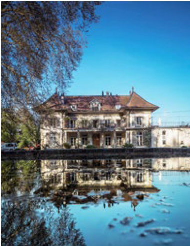
La casa solariega de la familia patricia de los Von Fischer data de la época feudal.

¿Más alto, más apartado, más rápido, más bonito? En busca de los récords suizos más originales. Hoy: de visita en el pueblo suizo más alejado de las fronteras.