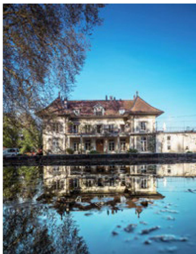
La casa solariega de la familia patricia de los Von Fischer data de la época feudal.

Tal parece que las fuerzas de la naturaleza se concertaron para crear, hace unos 14 000 años, las condiciones geográficas que permitieron a Uetendorf convertirse en un lugar tan especial. Al final de la última glaciación, los glaciares se retiraron lentamente, formando una cadena de pequeñas colinas que en la actualidad parecen miradores naturales desde los que puede divisarse Uetendorf y todo el