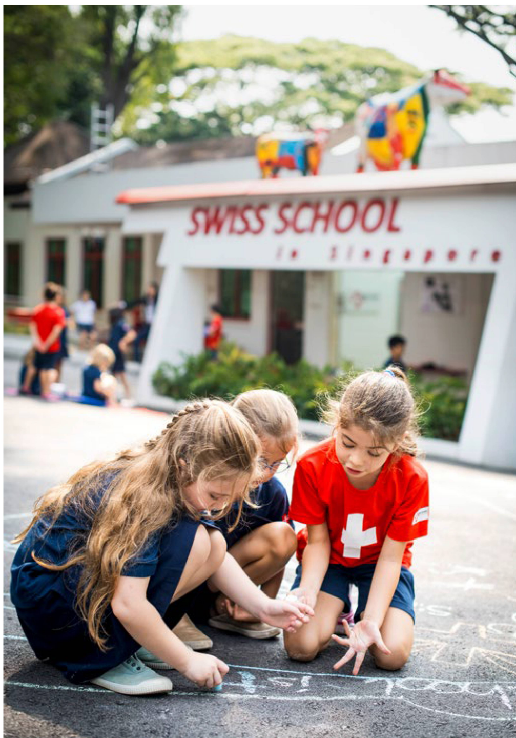
Alumnas jugando durante el recreo en la escuela familiar suiza de Singapur.

La Confederación apoya las 18 escuelas suizas oficialmente reconocidas en el extranjero. Éstas no sólo difunden la educación suiza en todo el mundo, sino que contribuyen a visibilizar la presencia cultural suiza en el extranjero, fomentando así una mejor comprensión de nuestro país, nuestras tradiciones y nuestros valores.