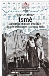
CILETTE OFAIRE "Ismé" Th. Gut Verlag, Zürich, 2020 560 páginas, CHF 39