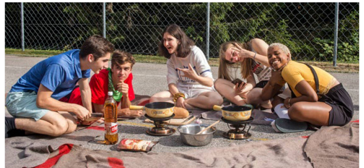
Todavía no se hablaba de mascarillas ni de reglas de distanciamiento: conviviendo alrededor de una sabrosa fondue durante el campamento deportivo y de ocio de 2019, en St. Croix.

Debido a la situación sanitaria en el mundo (pandemia del coronavirus), la Organización de los Suizos en el Extranjero ha tomado la difícil decisión de reducir el número de campamentos previstos inicialmente para 2021. Organizará solo dos campamentos: uno en los Alpes valdenses y otro en los Alpes valesanos. El campamento de verano tendrá lugar del 10 al 23 de julio de 2021 en Château-d’Oex y el campamento de invierno, del 27 de diciembre de 2021 al 5 de enero de 2022 en Grächen. La Organización de los Suizos en el Extranjero sigue, por supuesto, muy de cerca la evolución de la pandemia en el mundo. Cualquier cambio susceptible de afectar la organización de los campamentos se notificará en el sitio web www.SwissCommunity.org .