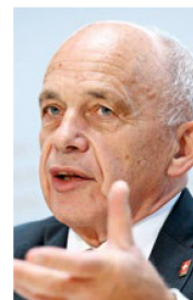
Ueli Maurer, Ministro de Finanzas: "Se ponderaron los pros y contras".

En una comparación internacional, Suiza experimentó un índice elevado de fallecimientos por coronavirus, a pe-