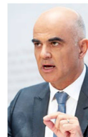
Alain Berset, Ministro de Salud Pública: "Suiza sigue su propio camino".