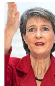
Simonetta Sommaruga, Presidenta de la Confederación