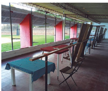
Línea de fuego pedana de armas largas