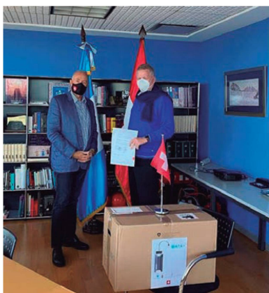
Hans-Ruedi Bortis, Embajador de Suiza, Jan Van Montfort, Director de programa de Helvetas

Suiza está comprometida con ayudar a las poblaciones vulnerables de Guatemala contribuyendo a mejorar su seguridad alimentaria y con el aporte de casi USD 4 millones ha contribuido a la respuesta humanitaria y atención a poblaciones afectadas por la pandemia del COVID 19 y por el paso de las tormentas ETA y IOTA.