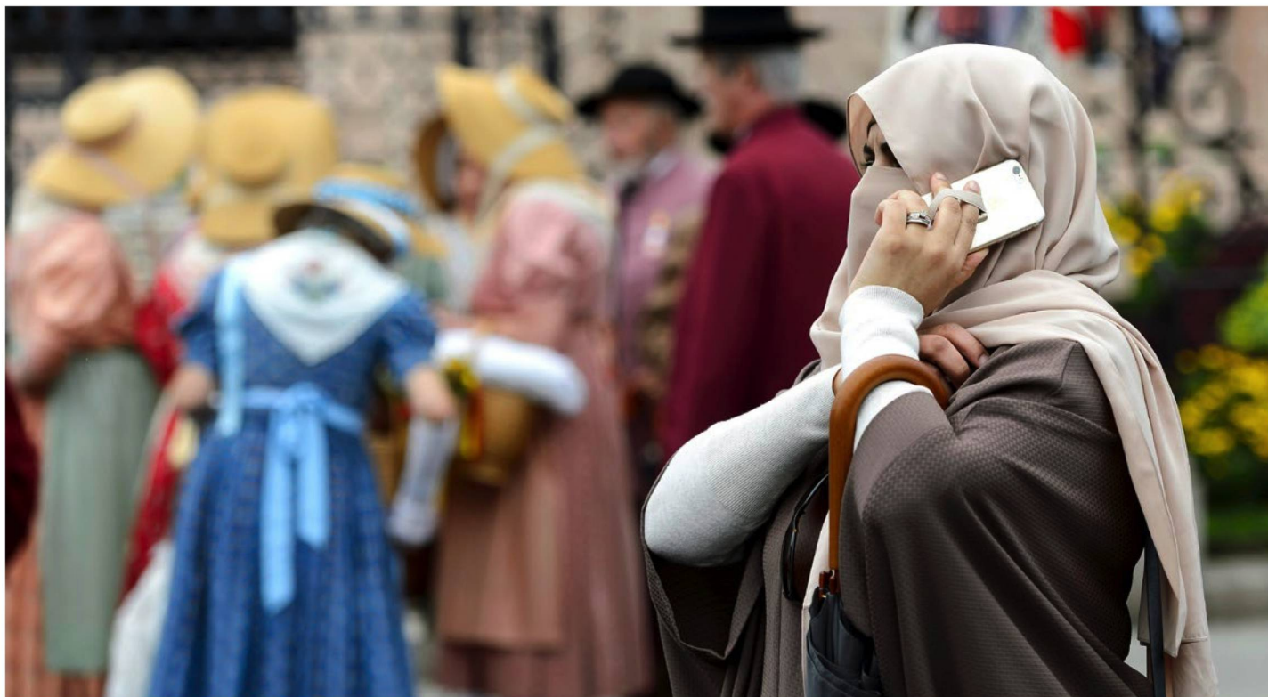
Una turista con velo integral se topa en Ginebra con un grupo folclórico local: el Comité de Egerkingen desea prohibir este tipo de encuentros.