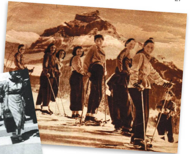
Recuerdos del campamento del año 1942: jóvenes suizas en el extranjero descubren el deporte de invierno en el Engelberg.