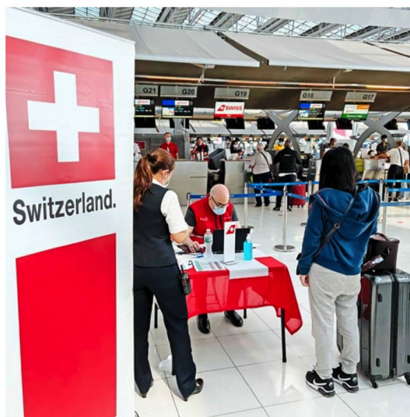
Apoyo consular a viajeros que regresan a Suiza, en el aeropuerto de Bangkok, Tailandia.

Entretanto, la ayuda se centra en las personas que hasta ahora no han podido o querido regresar. Se trata