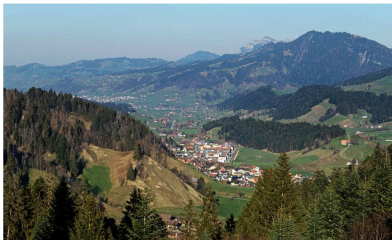
El escabroso terreno en los alrededores de Escholzmat (LU) no es adecuado para la agricultura. Las vacas, en cambio, se sienten a gusto allí.

Esta “ swissness ” falta muchas veces, sobre todo en las alternativas a la carne. En muchas ocasiones, los productos básicos vegetales no provienen de Suiza. En principio sería posible fabricar en Suiza alternativas vegetales a la carne ricas en proteínas y también cultivar las materias primas aquí, agrega Heine. Pero nuestro país está muy lejos de ese objetivo. En