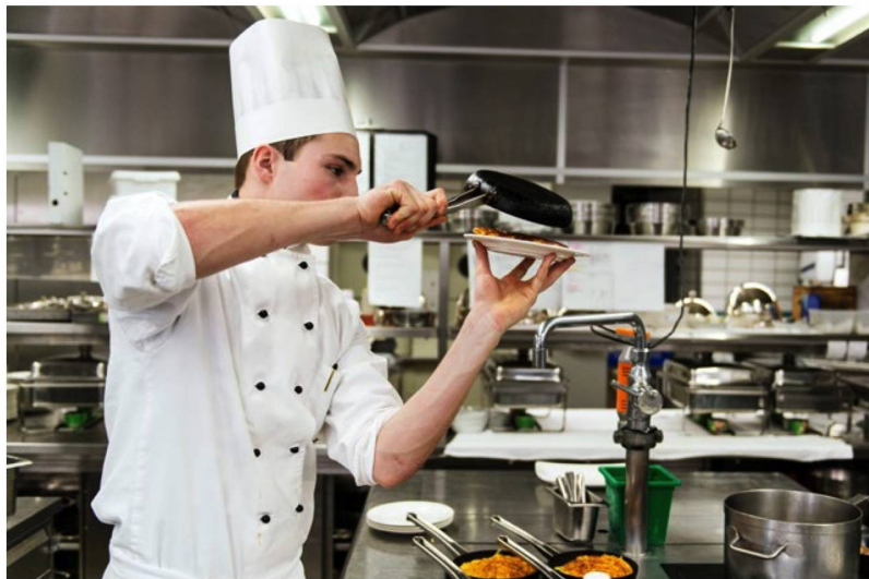
Recorrer el mundo como cocinero suizo: quienes trabajan en el extranjero no deben descuidar su previsión para la vejez.

Sin embargo, la Sra. B no podrá conservar su seguro obligatorio si durante su estancia en China trabaja para un empleador con sede legal en China.