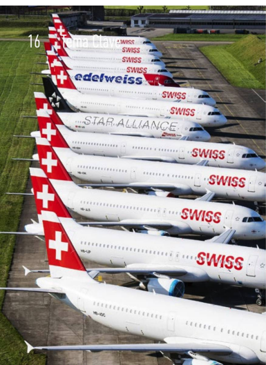
Imágenes del confinamiento que no se olvidarán: la flota de SWISS permanece inmovilizada casi por completo; Lucerna, urbe cosmopolita, luce sin turistas; se disparan las ventas de bicicletas en Suiza; y el recuerdo de días soleados en la Península de los Balcones.