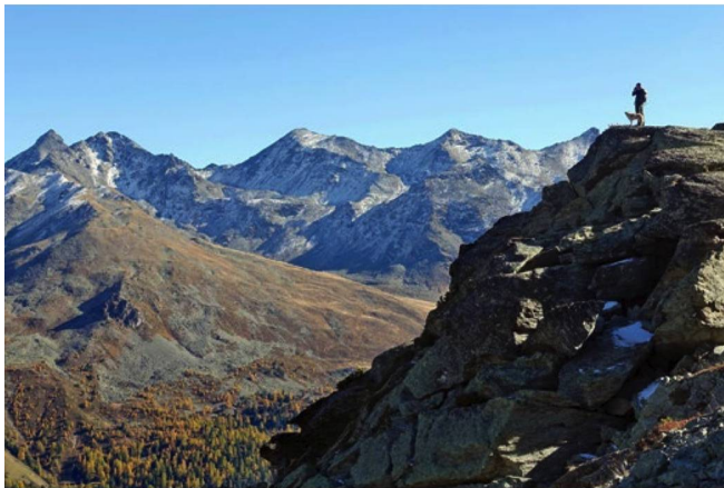
Observando lobos en el Valais: foto de la película "Die Rückkehr der Wölfe" ["El regreso de los lobos"], de Thomas Horat.

medidas de protección con casi tres millones de francos al año.