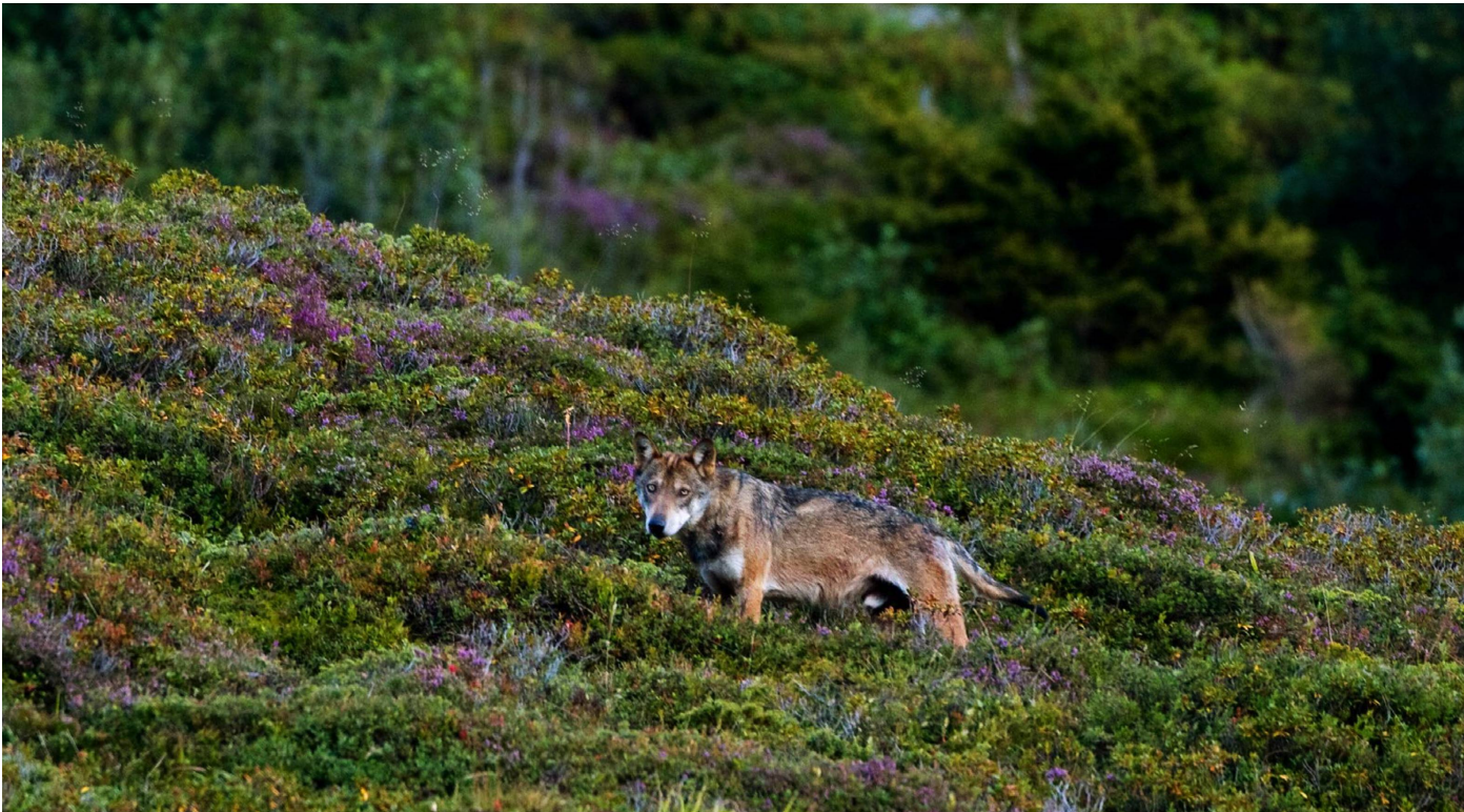
En agosto de 2006, el fotógrafo naturalista Peter A. Dettling logró tomar esta foto de un lobo salvaje en el distrito de Surselva; es una de las primeras fotografías que no se tomaron con una cámara trampa.