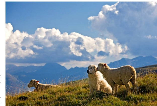
Un perro pastor ovejero, de la raza Maremmano Abruzzese, vigila ovejas en un pasto de alta montaña de los Grisones.

Los lobos mataron entre 1999 y 2018 a casi 3 700 animales, según indica una estadística de KORA, fundación para la ecología de los depredadores y la gestión de la fauna silvestre que, por encargo de la Confederación, supervisa la evolución de las poblaciones de depredadores y sus consecuencias. Los criadores perjudicados reciben de la Confederación y de los cantones indemnizaciones por los animales presa de los lobos. En el futuro, sin embargo, sólo se pagarán los daños si los animales han estado protegidos de forma adecuada, por ejemplo, mediante cercas eléctricas y perros especialmente entrenados que vigilan los rebaños de ovejas en los Alpes y los defienden contra los lobos. La Confederación subvenciona estas