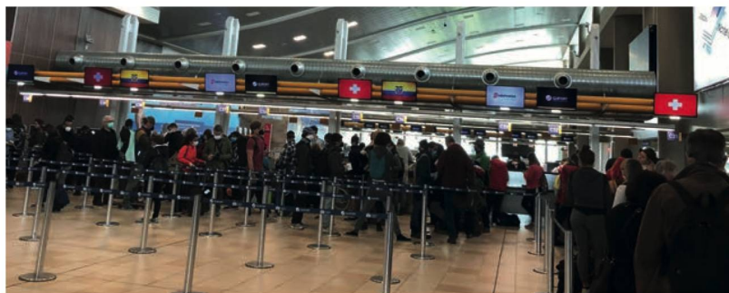
Check in en el Aeropuerto Internacional Mariscal Sucre/Quito