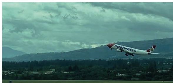
Partida del vuelo de Edelweiss

rias adicionales para COVID-19. Esto fue anunciado por el Vicepresidente Otto Sonnenholzner en las noticias: https://www.elcomercio.com/actualidad/otto-sonnenholzner-cadena-covid19-detenciones.html . Este dispositivo cuesta US $ 2 millones y fue totalmente donado por Roche.